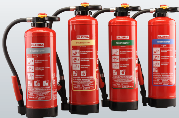
Pulver Schaum Öko-Tipp Wasser